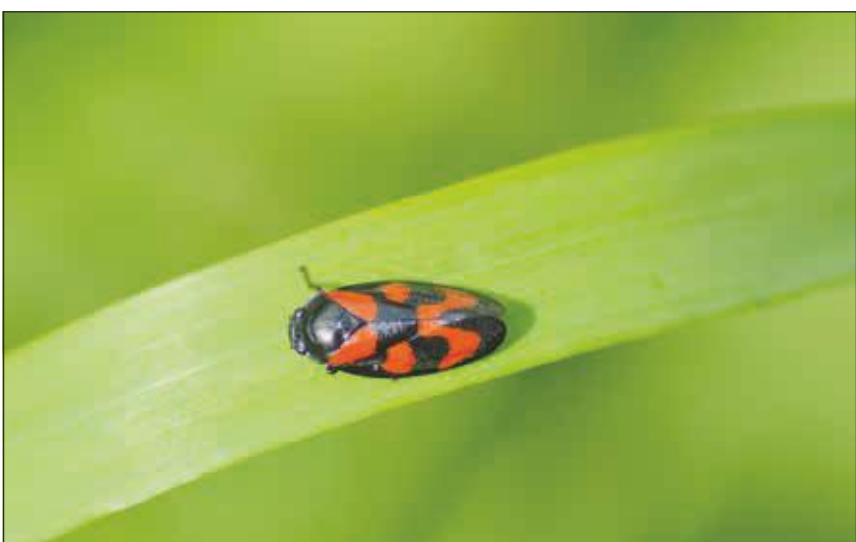
Den lille farverige fætter her er en blodcikade. Det er en ny art i Danmark, hoppet hertil fra Tyskland. Den blev første gang observeret i Frøsløv Mose i 2006, men findes nu en del steder i Sønderjylland og enkelte steder i Midt- og Østjylland.